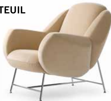
Leolux Anton Design: Studio Truly Truly, 2021